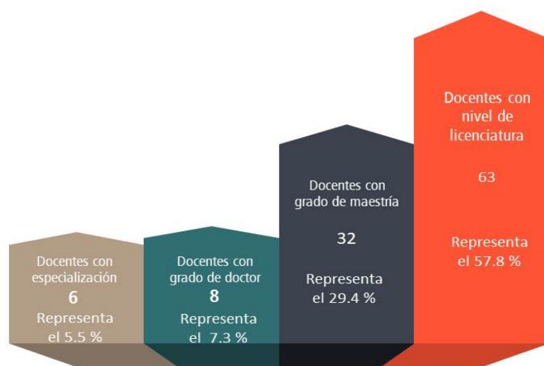
Figura 2. Plantilla de docentes por grado de estudio Semestre 2021-I. Extensión Académica Los Cabos.

Un área de oportunidad de la Extensión Académica Los Cabos es la contratación de profesores de tiempo completo que puedan crear cuerpos académicos, y de esa forma participar en investigaciones y en redes con otras instituciones del país.